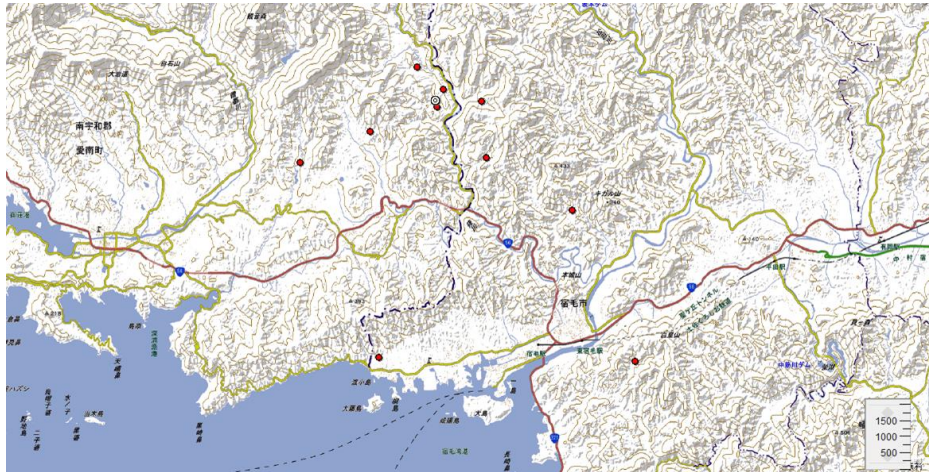
Fig. 1 Locations of MT sites are indicated as red circles. A double circle indicates the location of WSKK-006 (Yoshimura et al., 2016) and that of AS00 in this study.