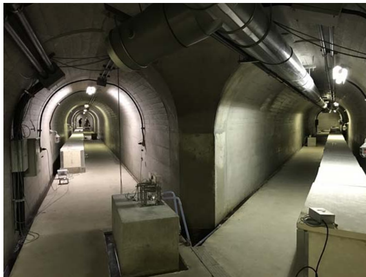
図 1. (上図) 新燃岳と伊佐観測坑道および図 2 で示した地震観測点の位置関係。 (下図) 伊佐観測坑道内部の様子。伸縮計は断熱材に保護されており、右が E1 成分，左が E3 成分である。E1 成分に直交するように E2 成分が設置されている。