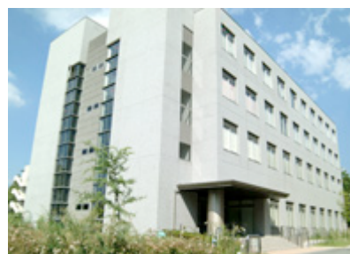
②化学研究所共同研究棟

お問い合わせ：自然災害研究協議会事務局 saigai-jimu@drs.dpri.kyoto-u.ac.jp